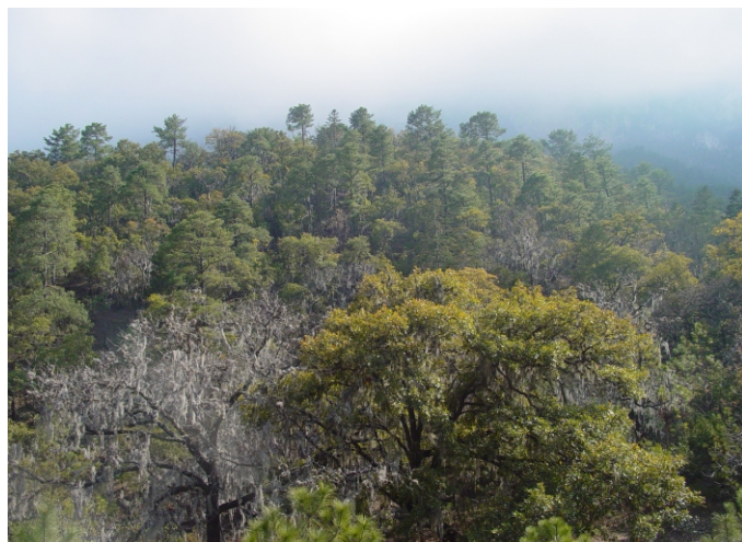
Vista panorámica de un bosque mixto de Quercus y Pinus , dentro del P.N. Cumbres de Monterrey