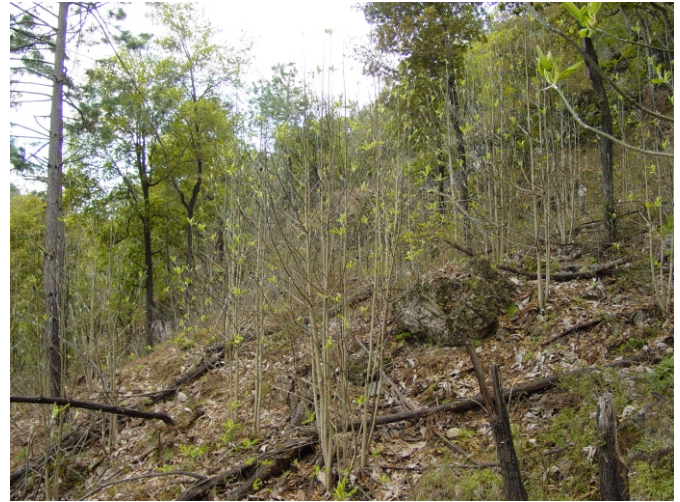
Población de Magnolia dealbata integrada dentro de un bosque mixto de Pinus , Quercus y Carya , entre otras especies

Quizás una de las especies de mayor interés, debido a su rareza no solamente en Nuevo León, sino en todo México, es Magnolia dealbata , aparentemente se conocen solamente algunas poblaciones en los estados de Veracruz, Hidalgo, Querétaro y Oaxaca, en su mayoría compuestas por solamente algunos ejemplares. Actualmente se realiza trabajo de campo para comprender mejor el estado actual de las poblaciones de esta especie en Nuevo León.