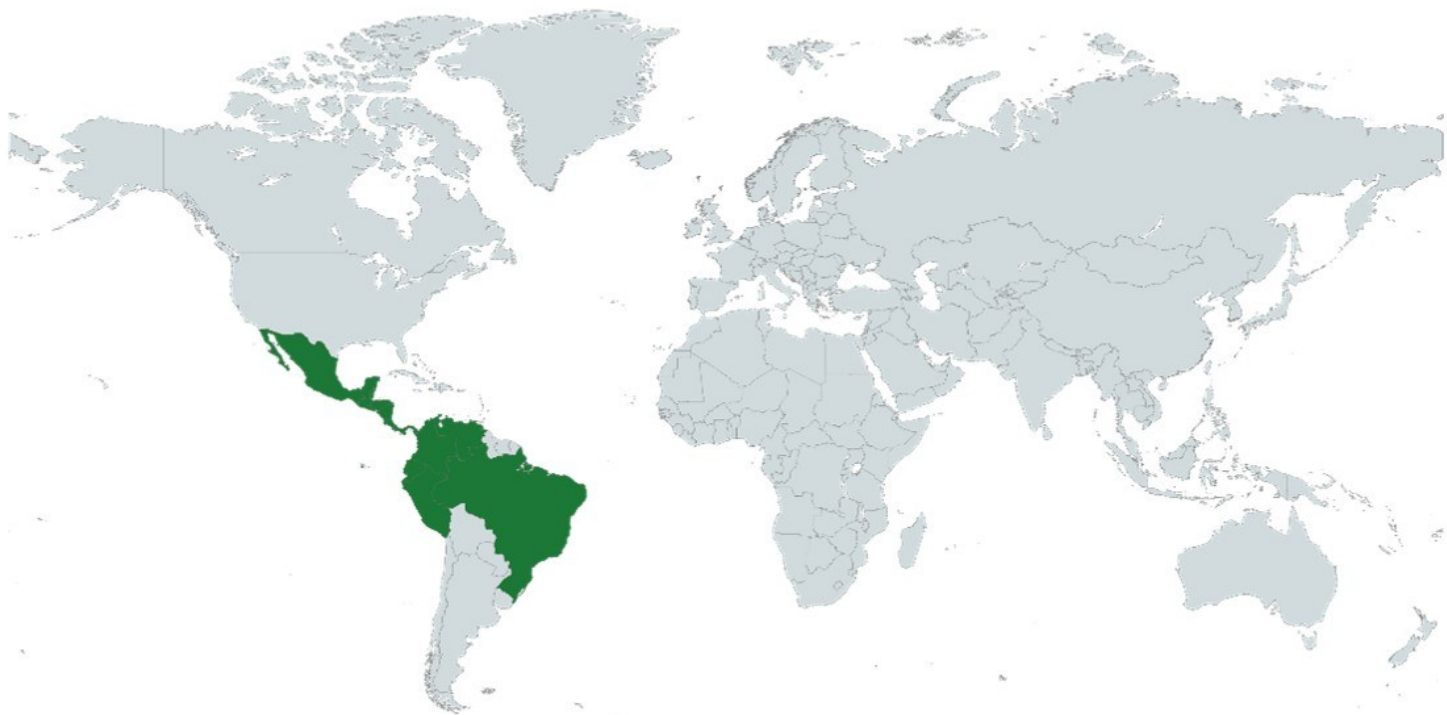
Figura 3. Distribución de Mimosa tenuiflora (tepezcohuite) en el mundo. Imagen propia

Cadena-Iñiguez P., Cruz-Morales F.D.C., Ballinas-Albores E. (2018). Tepezcohuite ( Mimosa tenuiflora (L.) Willd.) el árbol de