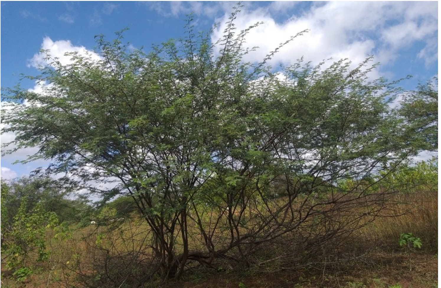
Figura 1. Árbol de Mimosa tenuiflora (tepezcohuite).